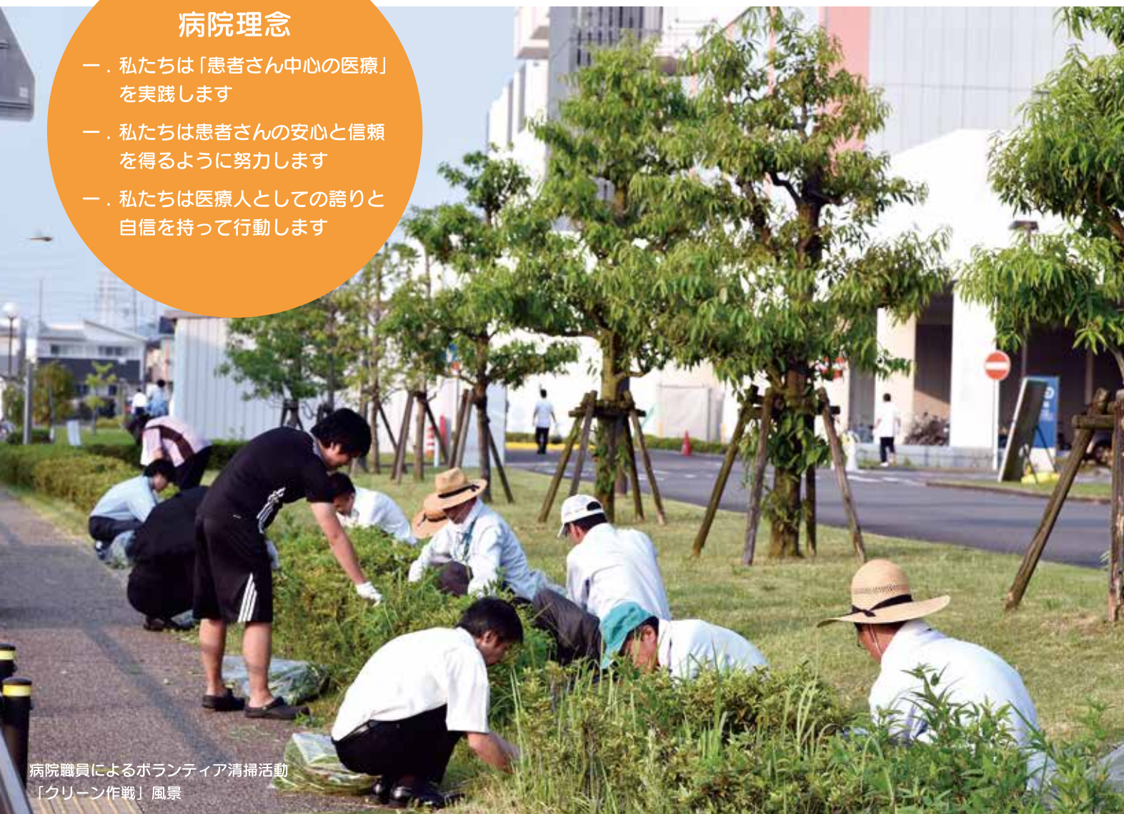
病院職員によるボランティア清掃活動 「グリーン作戦」風景