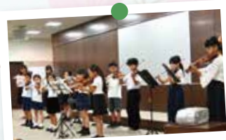
スズキ・メソード ヴァイオリンコンサート