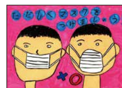
小1 7歳 母と