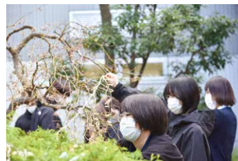
この木に電飾をつけようか！