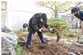
雑草も力いっぱい抜きます