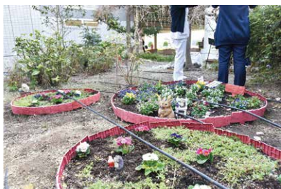
花壇が完成！ かわいい動物たちは何匹いるかな？

「どうしたら喜ばれるか」を仲間と考え、目標をたてて取り組みました。庭園づくりは目に見えてキレイになっていくので、とてもやりがいを感じています！