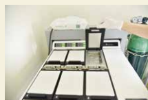
インキュベーター(培養器)

受精卵からさらに細胞分裂をすると「胚」と名前が変わります。胚を保存する器械・インキュベーターは、温度やガスをコントロールしてお母さんの体内を再現しています。