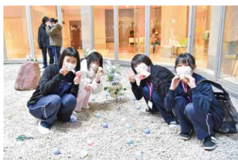
エレベーターホールから見てみてね！