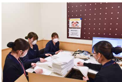
入院患者さんの清拭タオルを準備