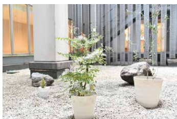
植木や飾りをつけて 明るい雰囲気になりました