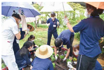
雨の日もへっちゃら