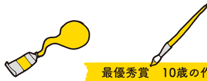
最優秀賞 10歳の作品