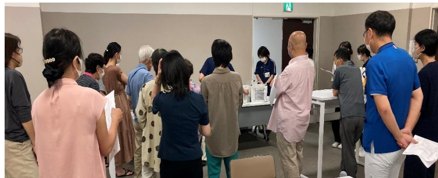
当日の事前説明。多くのオレンジサポーターさんらが集まりました