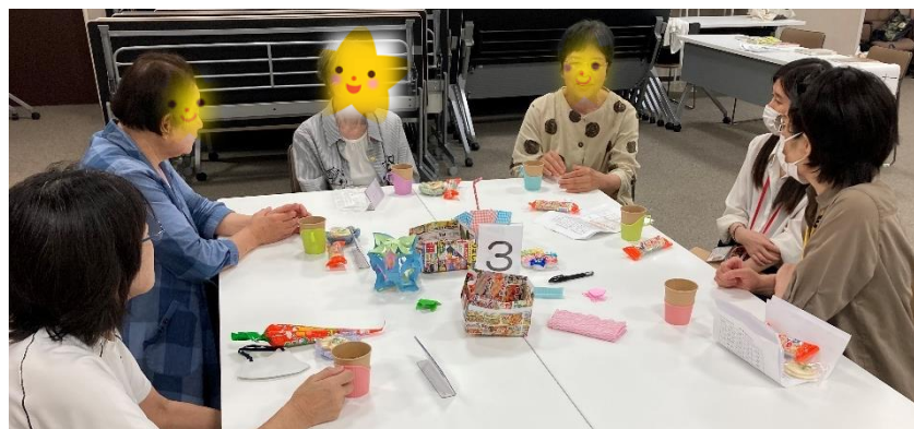
昔なつかしいポン菓子や、お茶を飲みながらのお茶会 お菓子を入れる編み物のお皿は高校生の皆さんの手作りです