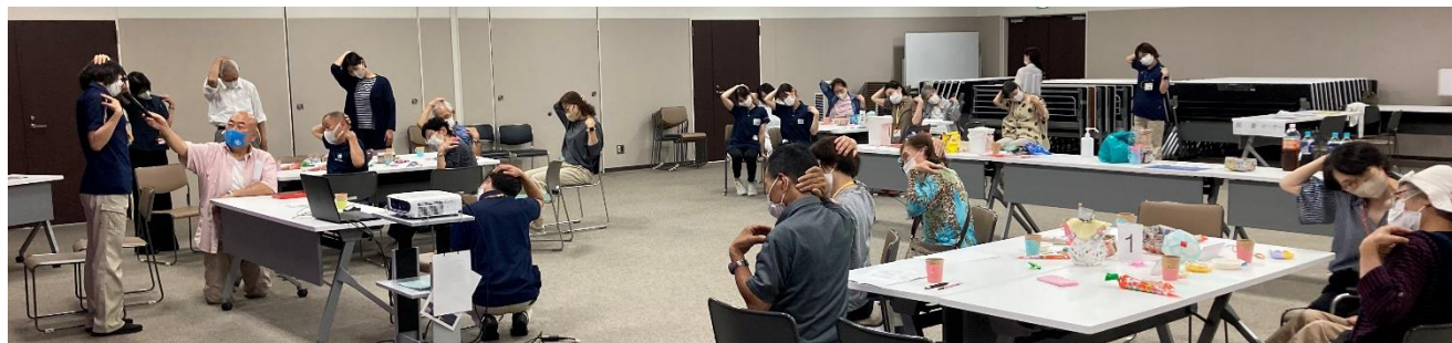
いろんな話、回想法クイズ、ストレッチやセタさまの歌も全員参加で楽しかったです♪