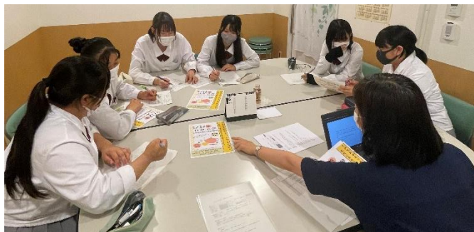
古知野高校生との打ち合わせ